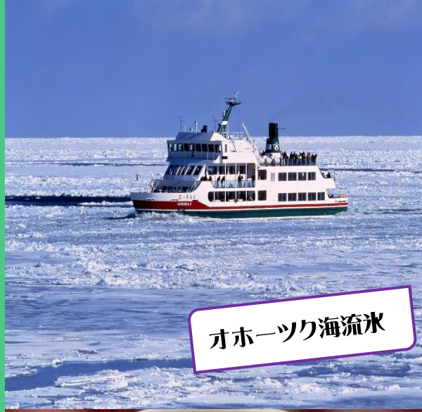
オホーツク海流氷