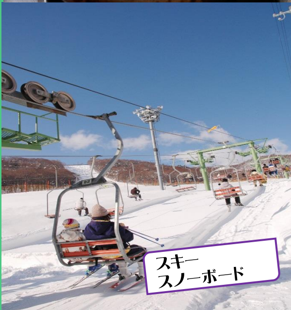
スキー スノーボード