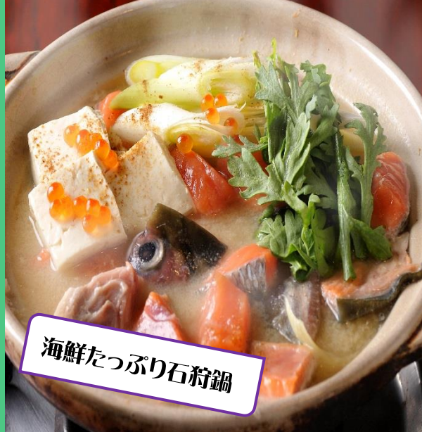
海鮮たっぷり石狩鍋