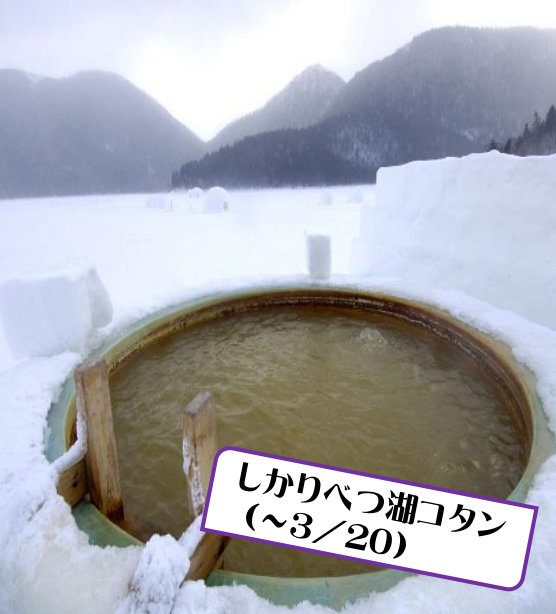
しかりべつ湖コタン (~3/20)