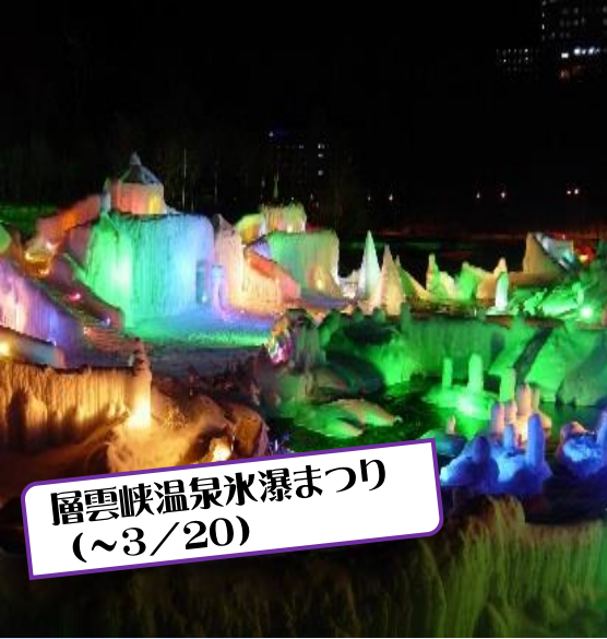
層雲峡温泉氷瀑まつり (~3/20)